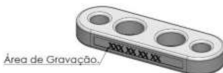
Figura 3 – Indicação de marcação.

A PLACA DE RECONSTRUÇÃO LIGAMENTAR CROSSFIX recebe marcação a laser contendo as seguintes informações: Lote, Logotipo e Dimensão. A gravação é efetuada no local especificado pelo Desenho Técnico, Figura 3, com base na norma ABNT NBR 15165, após a gravação, o produto deve ser inspecionado a fim de verificar se os dados gravados estão coerentes com o desenho e ordem de fabricação e se o produto sofreu algum dano. A realização dessa etapa é feita conforme IT.08.002 GRAVAÇÃO.