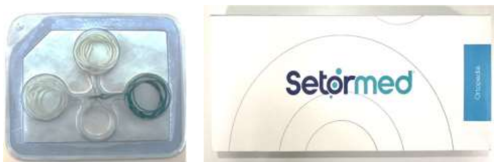
Figura 2 - Produto dentro da embalagem com a rotulagem.

A PLACA DE RECONSTRUÇÃO LIGAMENTAR CROSSFIX é fornecida, unitariamente em embalagem blister, fabricada em PET (politereflalato de etileno) e em embalagem terciária de papelão kraft. Acompanham a PLACA DE RECONSTRUÇÃO LIGAMENTAR CROSSFIX, 1 (uma) unidade de Instruções de Uso e 5 (cinco) Etiquetas de Rastreabilidade para cada unidade da embalagem, como indicado na Figura 2.