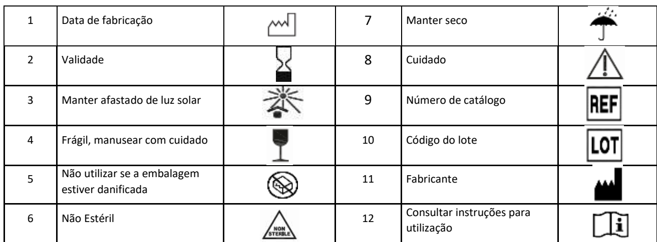
Figura 01: Simbologia da Rotulagem.

Legenda dos símbolos utilizados na rotulagem, conforme ISO 15223-1: